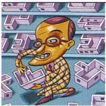
Illustration: Jürg Steiner