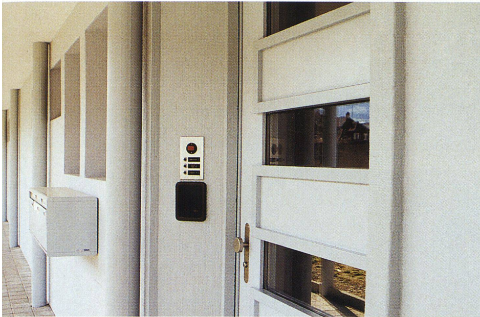
Vorbau auf Säulen: So erhielten die eher kleinen 3- und 4-Zimmer-Wohnungen zusätzliche zehn Quadratmeter Wohnraum.