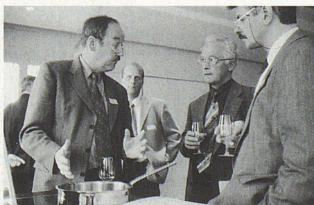
Das Time Out: Zeit für neue Küchentechnik (V-Zug) und persönliche Kontakte quer durch die Genossenschaften.