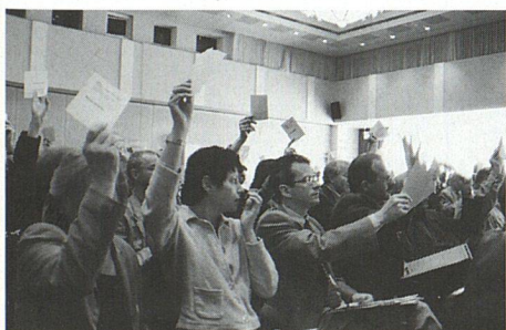
Die Abstimmungen: Alle Traktanden gingen oppositionslos durch.