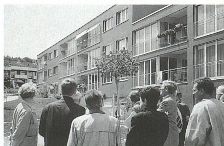
Die Besichtigungen: In Zürich-Schwamendingen das neueste Werk von Kuhn-Fischer-Partner ...