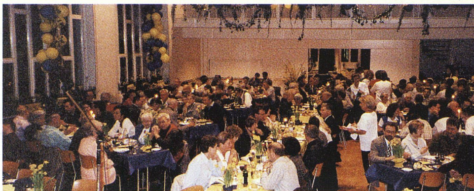
Rund 155 GenossenschaftlerInnen nahmen an der 40-Jahr-Feier der SILU teil.