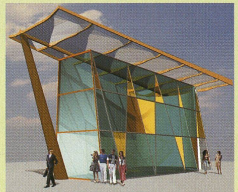
Das Hightech-Gebäude Phoenix empfängt die BesucherInnen auf dem Messeplatz.

Das Hightech-Gebäude Phoenix setzt konsequent auf die Nutzung traditioneller und neuer Holzwerkstoffe. So besteht der Massivbau aus Holz-Beton-Modulen, die neu entwickelt wurden. Der Werkstoff aus Holz und Zement – in der Vorfabrikation ebenso einsetzbar wie als Ortsbeton – verfügt über erstklassige Wärmespeicher- und Schallschutzeigenschaften. Das Dach ist in Holz-Hightech-Leichtbauweise erstellt und wird durch eine transparente, dämmende und tragende Teflonfolie ergänzt. Der sonnenseitige Teil des Daches wird mit einem Holzfaser-System gefüllt, das als Wärmepuffer dient und als Sonnenschutz ausgebildet ist.