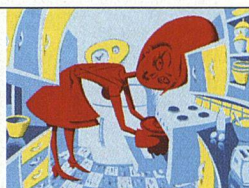
Illustration: Jürg Steiner