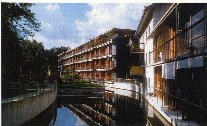
Die Stadt Uster hat den Wakkerpreis 2001 erhalten. Der Schweizer Heimatschutz zeichnete damit die vorbildliche Arbeit zur Aufwertung des Lebensraumes in der Agglomeration aus. Lobende Worte fand unter anderem die abgebildete Überbauung: Auf dem Areal einer ehemaligen Baumwollspinnerei entstand unter Einbezug der einmaligen Kanallandschaft und der schützenswerten Fabrikgebäude ein neues Ensemble mit zeitgemäßem Gepräge: Die attraktive Wohnüberbauung der Architekten Alder und Müller sowie das ans frühere Arbeiterhaus angebaute Wohn- und Atelierhaus der Architekten Moos, Giuliani und Hermann (im Bildvordergrund).