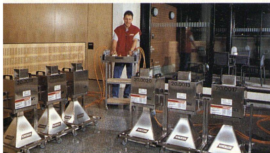
Die neue Wasserschaden-Sanierungsmethode

Mit den konventionellen Wasserschaden-Trocknungsmethoden stösst man immer wieder an physikalische Grenzen. Eine völlig neue Arbeitsmethode von Krüger eröffnet jetzt umfangreiche zusätzliche Einsatzmöglichkeiten: die Mikrowellen-Trocknung.