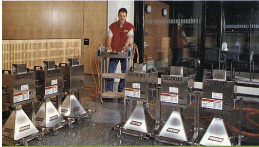
Die neue Wasserschaden-Sanierungsmethode

Mit den konventionellen Wasserschaden-Trocknungsmethoden stösst man immer wieder an physikalische Grenzen. Eine völlig neue Arbeitsmethode von Krüger eröffnet jetzt umfangreiche zusätzliche Einsatzmöglichkeiten: die Mikrowellen-Trocknung. Mikrowellen sind elektromagnetische Wellen mit einer Frequenz von 300 MHz bis 300 GHz. Sie sind damit im Frequenzband zwischen Radiowellen und dem sichtbaren Licht angesiedelt. Mit dieser Methode findet eine gründliche und schnelle Trocknung statt. Diese kontrollierte Trocknung, die von innen nach aussen wirkt, ist es denn auch, die den grossen Unterschied zu konventionellen Methoden ausmacht. In nur zwei bis drei Tagen werden Resultate erreicht, die sonst Wochen oder Monate in Anspruch nehmen. Erste Erfahrungen nach den Überschwemmungen