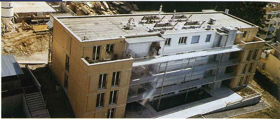
Das Mehrfamilienhaus umfasst zwölf Eigentumswohnungen.

reitung auf jedem Haus, der verantwortungsvolle Umgang mit ressourcenschonenden Baumaterialien wie zum Beispiel dem Brettstapel für die Gebäudehüllen, die Stärke der Wärmedämmung, die es erlaubt, die Gebäude als Niedrigenergiehäuser zu bezeichnen, oder auf gesellschaftlicher Basis die Tatsache, dass für die Umgebungsarbeiten ein Planungswettbewerb unter Landschaftsarchitekten veranstaltet wurde.