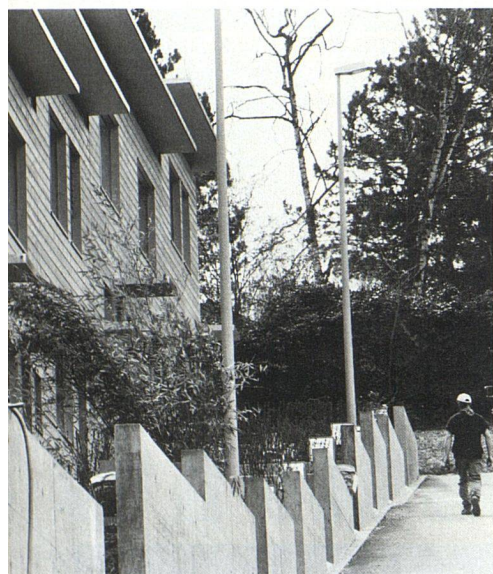
Bei den Fassaden kam eine neuartige Holzkonstruktion zur Anwendung.

ÖKOLOGISCHE UND GESELLSCHAFTLICHE ANLIEGEN. Dank klaren und übereinstimmenden ökologischen Grundsätzen der Bauträgerschaft und der Architekten beschränkte man sich in energetischer wie auch in bauphysikalischer und ökologischer Hinsicht nicht einfach darauf, minimale gesetzliche Anforderungen zu erfüllen. Vielmehr war die Verantwortung gegenüber der Umwelt und der Gesellschaft ein Kernthema der Planung und der Ausführung. Stellvertretend für diese Grundhaltung seien genannt: die Sonnenkollektoranlage für die Warmwasseraufbe-