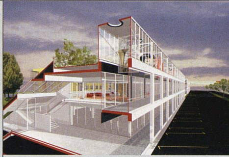
Die Geschäftszeile entlang der Bundesstrasse.