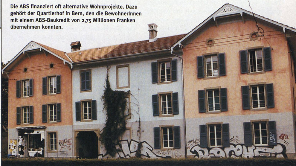
Die ABS finanziert oft alternative Wohnprojekte. Dazu gehört der Quartierhof in Bern, den die BewohnerInnen mit einem ABS-Baukredit von 2,75 Millionen Franken übernehmen konnten.