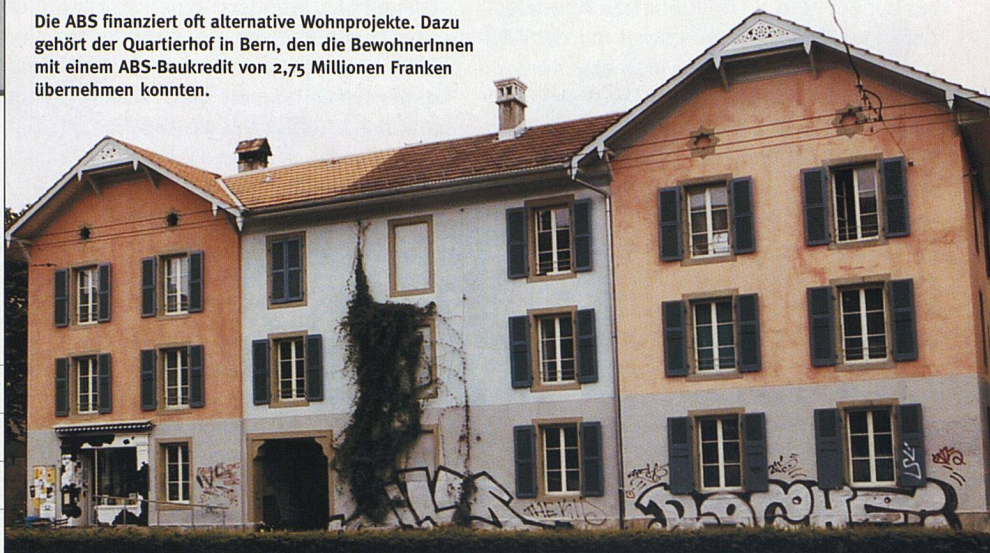
Die ABS finanziert oft alternative Wohnprojekte. Dazu gehört der Quartierhof in Bern, den die BewohnerInnen mit einem ABS-Baukredit von 2,75 Millionen Franken übernehmen konnten.