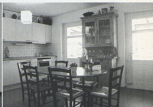
Die Küche wird zum neuen Gemeinschaftsraum.

in der Öffentlichkeit vermehrt preisgibt. Die ehemals deutlichen Grenzen von öffentlichem und privatem Raum erodieren.