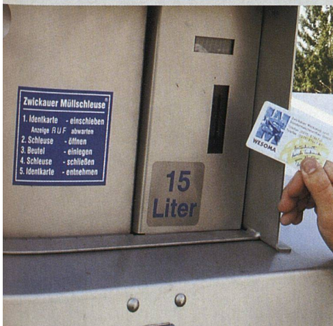
Zwickauer Müllschleuse: denkbar einfache Bedienung.