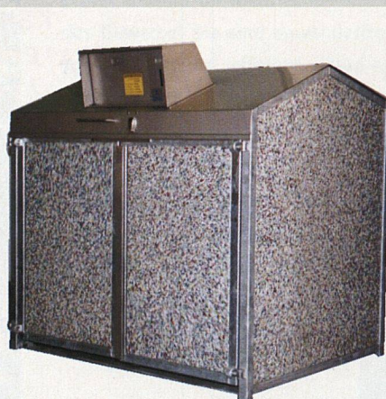
Gesamtansicht der Müllschleuse.