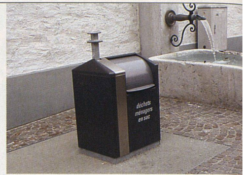
Tiefsammelstelle mit oberirdischen Einwurfsäulen. Der Sammelcontainer befindet sich in einem Betonschacht im Boden.

Allerdings könnte die Bereitstellung solcher Container zur illegalen Entsorgung animieren, denn auch in Chur kennt man das System mit der Sackgebühr. Dies geschieht aber selten, wozu möglicherweise die mit Absicht sehr auffallend gefärbten «Churer-Säcke» beitragen. In Grossstädten, wo Kehricht häufiger illegal deponiert wird, würde das Molok-System für Gebührensäcke wahrscheinlich nicht funktionieren, meint Schneeberger. Der