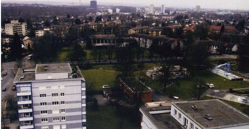
Schwamendingen verdichten? Wegen der dringend notwendigen Erneuerung vieler Liegenschaften steht das Quartier, eine Hochburg der Baugenossenschaften, vor tief greifenden Veränderungen.

Titel «Boomgebiete der Zukunft – die Stadtrandquartiere», die am 25. September um 20 Uhr im Kongresszentrum Spigarten in Zürich-Altstetten stattfindet. Sie geht davon aus, dass nach Zürich-Nord und Zürich-West die neuen Boomgebiete Altstetten, Schwamendingen, Seebach und Affoltern heissen. Dort, wo die grossen Siedlungen der Baugenossenschaften stehen, wird in den kommenden Jahren saniert, umgebaut und abgerissen. Gleichzeitig dürfen diese Gebiete wegen der neuen Bau- und Zonenordnung sehr viel dichter bebaut werden. Die Umgestaltung am Stadtrand dürfte damit zu den brisantesten stadtentwicklungspolitischen Themen der nächsten Jahre und Jahrzehnte zählen. Für wen wird hier gebaut? Wird sich die Lebensqualität verbessern oder verschlechtern? Können die jetzigen BewohnerInnen mitbestimmen? Über diese Fragen diskutieren Kathrin Martelli, Vorsteherin Hochbaudepartement, Niklaus Scherr, Mieterverband, Markus Zimmermann, Förderstelle Gemeinnütziger Wohnungsbau, Catherine Rutherford, Arbeitsgruppe Staudenbühl Gewobag, Gunthard Niederbäumler, BG Glattal, Gesprächsleitung: Richard Wolff, Stadtforscher.