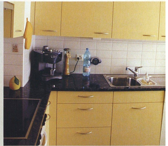
Aus Alt mach Neu, hier in einer Liegenschaft der Baugenossenschaft Asig: Weg vom 60er-Jahre-Mief hin zur modernen Küche.

Planungs- und Kalkulationsarbeit geleistet werden. Das geht bis hin zur Spezifizierung von Scharnieren und Möbelgriffen. Dieser Forderungskatalog lässt sich unterteilen in Muss-Kriterien und in Wünschbares. Wobei das Dilemma zwischen «must» und «nice to have» nicht nur durch den finanziellen Rahmen beeinflusst wird, sondern auch durch den Grundriss oder durch bestehende Installationen. Moderner Küchenkomfort ruft häufig nach mehr Platz, als möglicherweise zur Verfügung steht. Im Weiteren ist der Planungshorizont zu berücksichtigen. Wird die Siedlung in sieben Jahren abgebrochen und nur noch behelfsmässig renoviert, ist anders zu planen, als wenn das Objekt noch viele Jahrzehnte seinen Dienst tun soll. Es können Erfahrungswerte aus anderen Siedlungen mitberücksichtigt werden. Die meisten Genossenschaften geben die Erfahrungen nach