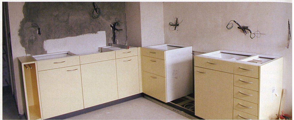
Bei der Küchenmontage müssen Schreiner, Sanitär, Elektriker, Plättlileger und Maler koordiniert werden. Das verlangt Flexibilität, Organisationstalent und Fachwissen.

und Küchenbauer. Schliesslich sei auf den professionellen Auftritt der Küchenmonteure auf der Baustelle hingewiesen: Das Verständnis für die Belastung der Mieterschaft durch den Umbau drückt sich etwa darin aus, dass in der fremden Wohnung weder geraucht noch Musik gehört wird und dass die Handwerker sauber gekleidet daherkommen und im Kundenkontakt freundlich sind! – Sorgfältige Planung und Zusammenarbeit mit einem kompetenten Partner sind Basis einer gelungenen Küchenrenovation . . . und die schöne Küche ein Grund zur Freude am Kochen. ☺