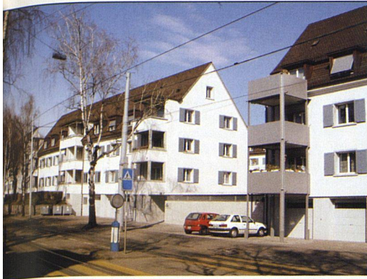
Nicht verstecken wollen sich die stählernen Balkontürme der Baugenossenschaft Hofgarten in Zürich-Unterstrass. Typologisch führen sie die Loggien gegen die Hofwiesenstrasse weiter (links).

Wegen Auflagen der Stadt wählte die Baugenossenschaft Schönheim eine stützenfreie Balkonkonstruktion. Die neuen Balkone der Siedlung Eyhof in Zürich-Albisrieden sind mit U-förmigen Trägern an der Fassade befestigt.