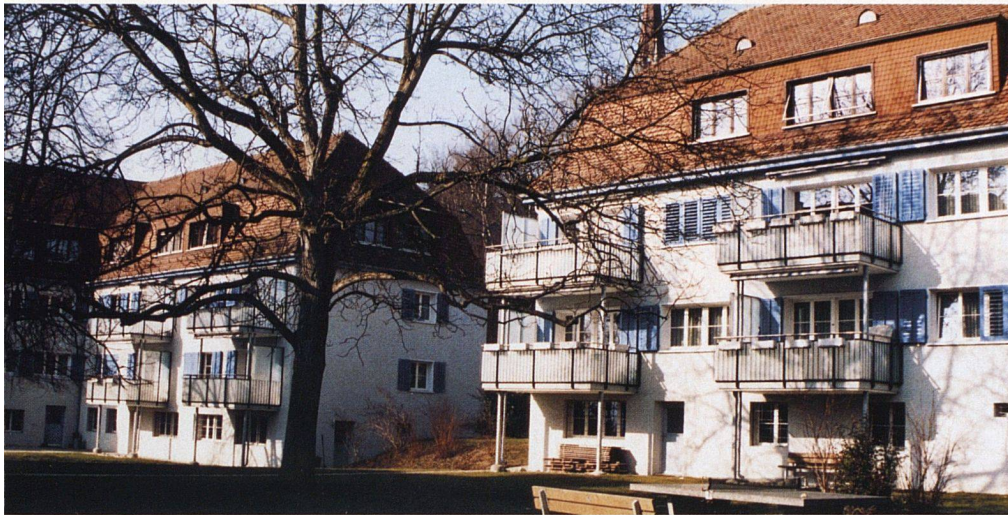
Denkmalpflegerisch gelungene Lösung bei den neuen Balkonen der Siedlung Geibel in Zürich-Wipkingen (Baugenossenschaft Waidberg): In einer statischen Mischkonstruktion sind sie an den Häusern aufgehängt und zusätzlich mit schlanken Pfeilern abgestützt

insbesondere bei Sanierungen ganzer Siedlungen an Virulenz gewinnen. Der intervenierende Gestus in den Aussenraum der Siedlungen hinein, der veränderte architektonische Ausdruck der Fassade nach der Sanierung, der kostenbedingte Druck, zu fixfertigen, aber architektonisch unbefriedigenden Systemlösungen zu greifen – dies alles sind Themen, deren Auswirkungen schon lange den Siedlungsraum der Schweiz zu prägen begonnen haben.