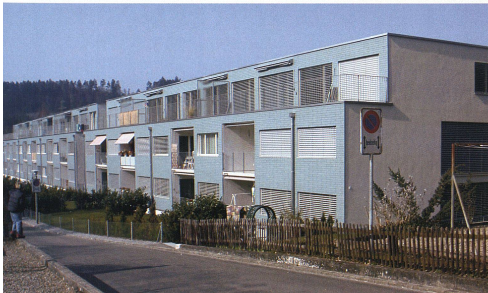
Vom Sitzplatz über den französischen Balkon bis zur grosszügigen Terrasse reichen die unterschiedlichen Aussenräume.

Die überdurchschnittliche Tiefe der Gebäude von rund 14 Metern ermöglichte neben der Reduktion der Gebäudeoberflächen ein einfaches, leicht zu variierendes Grundrisschema. Jeweils um einen Nasszellenkern herum gruppieren sich der Wohn- und Essraum mit der dazu gehörigen Küche sowie, je nach Wohnung, ein bis vier weitere Zimmer. Ihre geschickte Ausbildung als Schaltzimmer machte die oben angesprochene Planungsflexibilität möglich. Innen wie aussen kamen betont einfache Materialien zum Einsatz. Die Wohnräume sind mit Parkettböden ausgestattet, die einzelnen Zimmer mit Linoleumböden. Aussen prägt die bläulich eingefärbte Eternitfassade das Bild der neuen Überbauung. Die Stirnseiten sind jeweils mit Aussen-