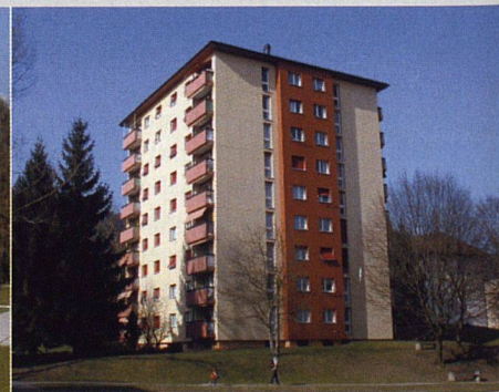
Liegenschaften der Genossenschaften Allmend, Arve und Gstdalen in Horgen.