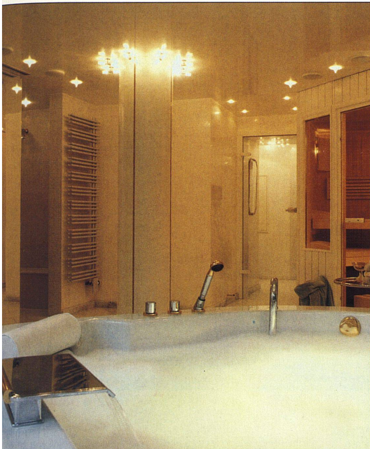
Gelbe oder grüne Pastelltöne empfiehlt Max Lüscher für das Badezimmer.