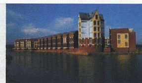
Frank-Bertolt Raith | Lars Hertelt | Rob van Gool Insenzierte Architektur Wohnungsbau jenseits des Standards

Frank-Bertolt Raith, Lars Hertelt, Rob van Gool Insenzierte Architektur 160 Seiten, 220 Bilder, 155 CHF Deutsche Verlags-Anstalt, Stuttgart/München 2003