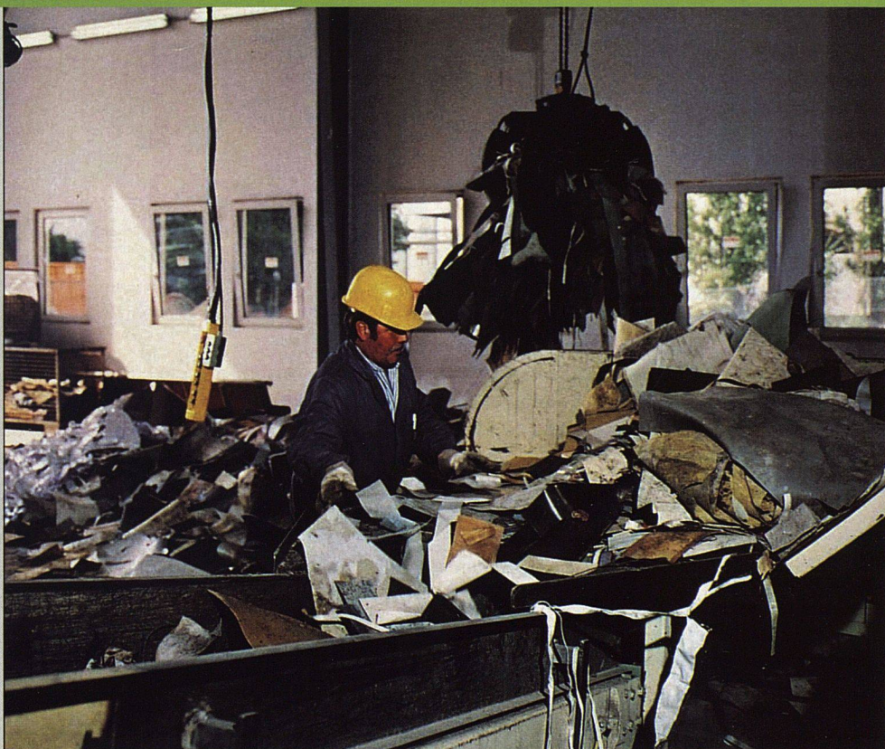
In der PVC-Recyclinganlage in Troisdorf (D) können auch alte Bodenbeläge aus der Schweiz einer sinnvollen Wiederverwertung zugeführt werden.

Um dies zu erreichen, hat man gemeinsam mit der Firma Setz Gütertransport AG ein Rücknahme- und Verwertungssystem entwickelt. Die abgebenden Unternehmen oder Bodenleger fordern bei der Setz AG Paletten an und füllen sie mit dem recyclingfähigen Material. Der Spediteur kümmert sich sodann um den Transport der alten PVC-Beläge zur