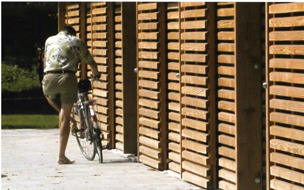
Mit seinen rostartigen Paneelen aus Fichtenholz wirkt der Unterstand im Hof wie ein Vorhang.

nierte Profil dieser Konstruktion schafft eine nun unzweideutige Grenze zwischen Strassen- und Siedlungsraum. Durchlässig ist der Unterstand dagegen vom Hof aus gesehen. Aus Fichtenholz vorfabrizierte Schiebetüren bilden die Eingangsbereiche zu den einzelnen Abstellkojen. Aneinander gereiht wirken die rostartig ausgebildeten Paneele wie ein Vorhang, der erst richtig aufmerksam macht auf das, was er