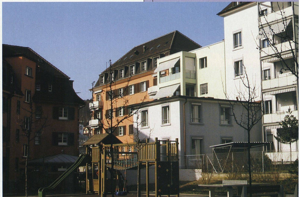
Blick von der Hofseite. Hier profitieren die Bewohner von der neuen Aussenraumgestaltung der Kolonie Letten.

toverkehr und wenig Grünraum in Kauf zu nehmen. Die potenziellen Kundinnen und Kunden für genossenschaftliche Ergänzungsbauten sind also vorhanden. Dass sie damit gerade in Quartieren wie dem Zürcher Kreis 4 einen wichtigen Beitrag zu einer ausgewogenen Durchmischung der Bewohnerschaft leisten, liegt auf der Hand. Klar ist aber auch: Solche Projekte müssen einige Hürden nehmen und lassen sich kaum preisgünstig umsetzen. Die befragten Archi-