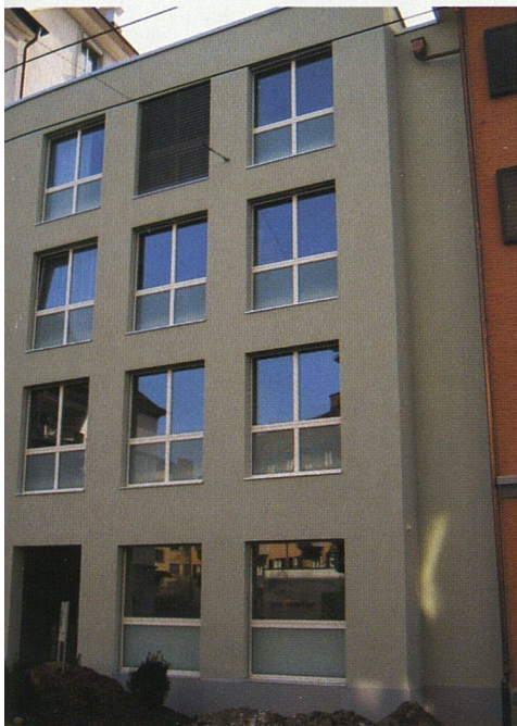
Der Zwischenbau von der Strassenseite.

Baukosten (Neubau und Umbau Nachbargebäude): 5,5 Mio. CHF