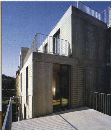
Blockrandflucht mit Balkon, Terrasse im Dachgeschoss und Dachzinne.