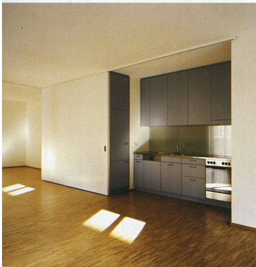
Die Wohnräume sind um einen zentralen Kern mit Küche und Nassraum gegliedert. Der Küchenblock lässt sich mit einer Schiebetür abtrennen.

Wipkingen ist in den letzten Jahren gerade bei einem jüngeren Publikum zu einem beliebten Wohnquartier geworden. Nicht nur dass sich hier ein urbanes Umfeld mit vielen alten Stadthäusern und charaktervollen Wohnungen findet. Das Stadtzentrum ist mit Bus oder Bahn in wenigen Minuten erreichbar. Der trendige Kreis 5 liegt gleich nebenan, das einst als Drogenumschlagplatz geschmähte Limmatufer rund um den alten