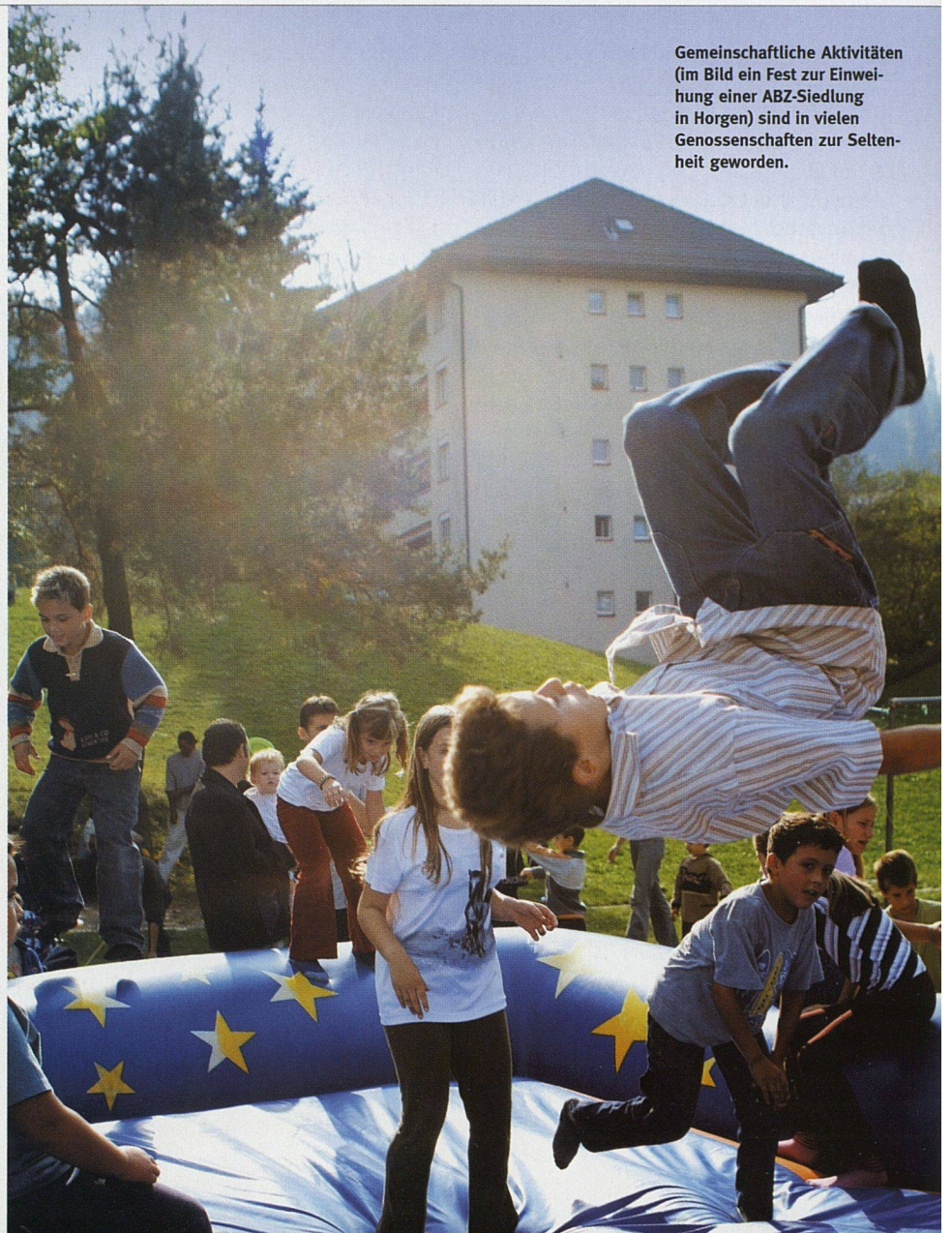
Gemeinschaftliche Aktivitäten (im Bild ein Fest zur Einweihung einer ABZ-Siedlung in Horgen) sind in vielen Genossenschaften zur Seltenheit geworden.

Ich hatte das eigentlich erwartet. Bis jetzt habe ich solche Themen allerdings wenig angetroffen. Eine einzige Genossenschaft ist bezüglich Vandalismus an mich herangetreten. Die Integration von Bewohnenden aus anderen Kulturkreisen ist allerdings ein