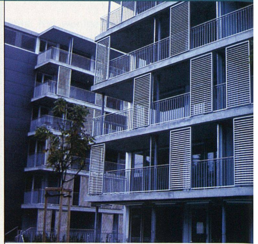
Ein Beispiel für innovative Fassadengestaltung: Die Wohnüberbauung Dennlerstrasse mit den Schiebe-Lamellen von Hammer Metallbau.

Weil im bitterkalten Winter 1929 nicht nur der See zufror, sondern auch der Boden bis tief in den Frühling hinein pickelhart war, konnten die Gärtner wochenlang nicht arbeiten und mussten schmerzliche Lohnausfälle und -kämpfe hinnehmen. Aus der Not schlossen sie sich zu einer Genossenschaft zusammen. So entstand die Gartenbau-Genossenschaft Zürich (GGZ), die diesen November ihr 75-jähriges Bestehen feiern kann. Glücklicherweise ging die Gründung der GGZ Ende der 20er-Jahre mit der Entstehung zahlreicher Wohnbaugenossenschaften einher, die denn