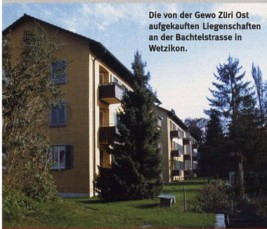
Die von der Gewo Züri Ost aufgekauften Liegenschaften an der Bachtelstrasse in Wetzikon.