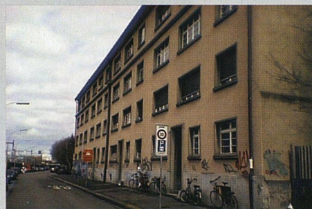
In der Berner Lorraine (links) und im Basler Klybeck-Quartier konnten Genossenschaften mit Hilfe des Solidaritätsfonds Liegenschaften erwerben.