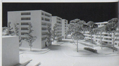
Mit dem Neubauprojekt von KGP Kyncl Architekten setzt die Genossenschaft der Baufreunde in Schwamendingen auf hohe Wohnqualität.

schutz, eine kontrollierte Wohnungslüftung und hochwertige Materialien. Dennoch soll eine 4½-Zimmer-Wohnung mit 126 m 2 Fläche nicht mehr als 1900 Franken kosten. Baubeginn ist Anfang dieses Jahres, ab Sommer/Herbst 2006 sollen die Wohnungen bezugsbereit sein. (pd/rom)