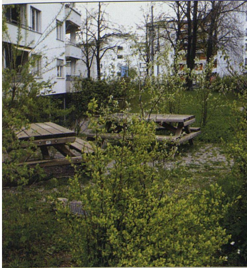
Dank einer geschickten Umgebungsgestaltung entstand in der Siedlung Farbhof trotz der nicht sehr idyllischen Lage eine grüne Oase. Wildhecken und Bäume schirmen den Sitzplatz vom Verkehr ab.