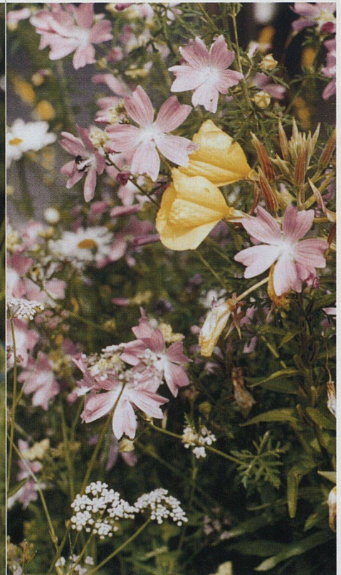
Wer an sonniger Lage Erde statt Kies einbringt und Pionierflora ansät, wird mit schöner Farbenpracht und seltenen Blumen belohnt. Die Bilder zeigen eine Komposition mit Wilder Möhre, Wegwarte, Malve und Leinkraut (links); Königskerze (Mitte); Nachtkerze und Malve (rechts).