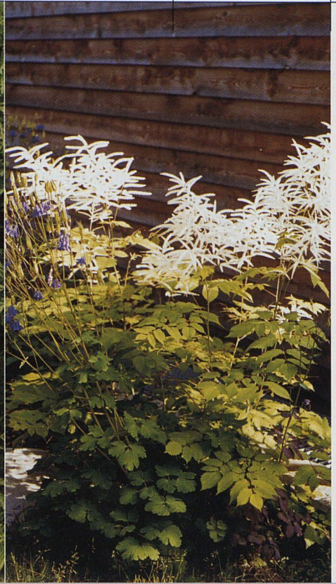
Stauden sind aufwändiger in der Pflege als Hecken, doch wenn man auf den richtigen Standort achtet, unproblematisch. Schwarze Königskerzen (Bild links), eignen sich für ein breites Standortspektrum, der Blutweiderich dagegen hat es lieber feucht (Mitte), der Waldgeissbart zieht Schatten vor (rechts).