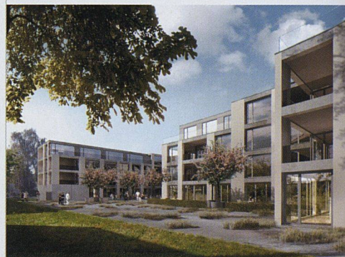
30 bis 40 preisgünstige Wohnungen will die Baugenossenschaft Zurlinden auf dem ehemaligen Fabrikareal in Zürich Wollishofen erstellen.

Wirtschaftlichkeit besondere Beachtung geschenkt werden, allerdings ohne Abstriche an das hohe architektonisch-städtebauliche Niveau und die Qualität der Wohnungen. (rom)