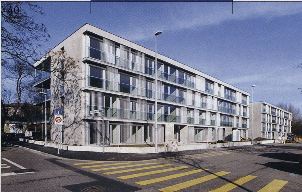
Die Bau- und Verwaltungsgenossenschaft Wohnstadt errichtete an der Gellertstrasse zwei Bauten mit Miet- und Eigentumswohnungen. Die Preise bewegen sich zwar im gehobenen Bereich, dürfen jedoch angesichts der Lage als durchaus gerechtfertigt gelten (Architektur: Kläy und Weber, Basel).