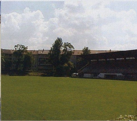
Angesichts von Randlage und Umfeld bietet die kantonale Überbauung Riehenring Standards, die die Grenzen des Marktes sprengen: ein kostspieliger Versuch, Bevölkerungspolitik mit Wohnungsbau zu betreiben (Architektur: Trinkler Ferrara Engler, Basel).