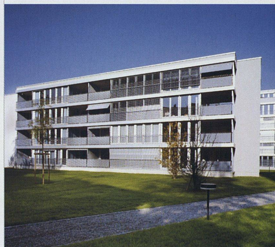
Die von der Winterthur Leben erstellte Wohnüberbauung an der Thiersteinallee bietet grosse Wohnungen mit Mietzinsen ab 2250 Franken. Die Vermietung bereitete keinerlei Probleme (Architektur: Burckhardt und Partner, Basel).

Am 27. Februar 2005 wurde vom Basler Souverän die Einzonung des Erlenmattquartiers bestätigt und damit die zonenrechtliche Grundlage geschaffen, in den nächsten 15 bis 20 Jahren insgesamt 700 Wohnungen zu erstellen. Der aus zwei Wettbewerben hervorgegangene Bebauungsplan von Ernst-Niklaus-Fausch bietet Wohnbauten mit viel vorgelagertem Freiraum. Auf dem ersten ▶