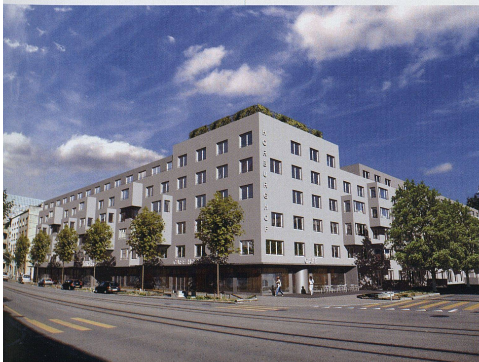
Im kurz vor der Vollendung stehenden Horburghof (Helvetia Patria und Basler Versicherung) ist eine grosse Wohnung schon für 2000 Franken zu haben. Die Überbauung gilt als Indikator für die Nachfrage im Stadtentwicklungsgebiet Basel Nord (Architektur: Zophoniasson und Partner, Basel).