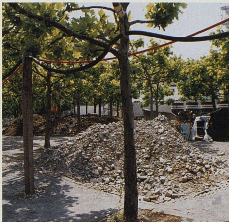
Der ursprünglich vom berühmten Landschaftsarchitekten Ernst Cramer entworfene Hof erhält eine vorsichtige Aufrichtung.