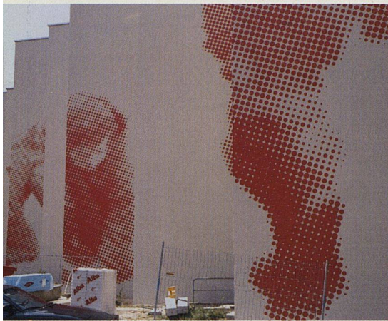
Die künstlerische Fassadengestaltung symbolisiert die kinderfreundliche Siedlung mit grossem Hof, Kindergarten und Hort.