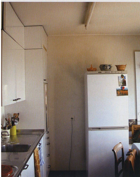
Immer häufigere Reparaturarbeiten: Die Küche vor der Sanierung.