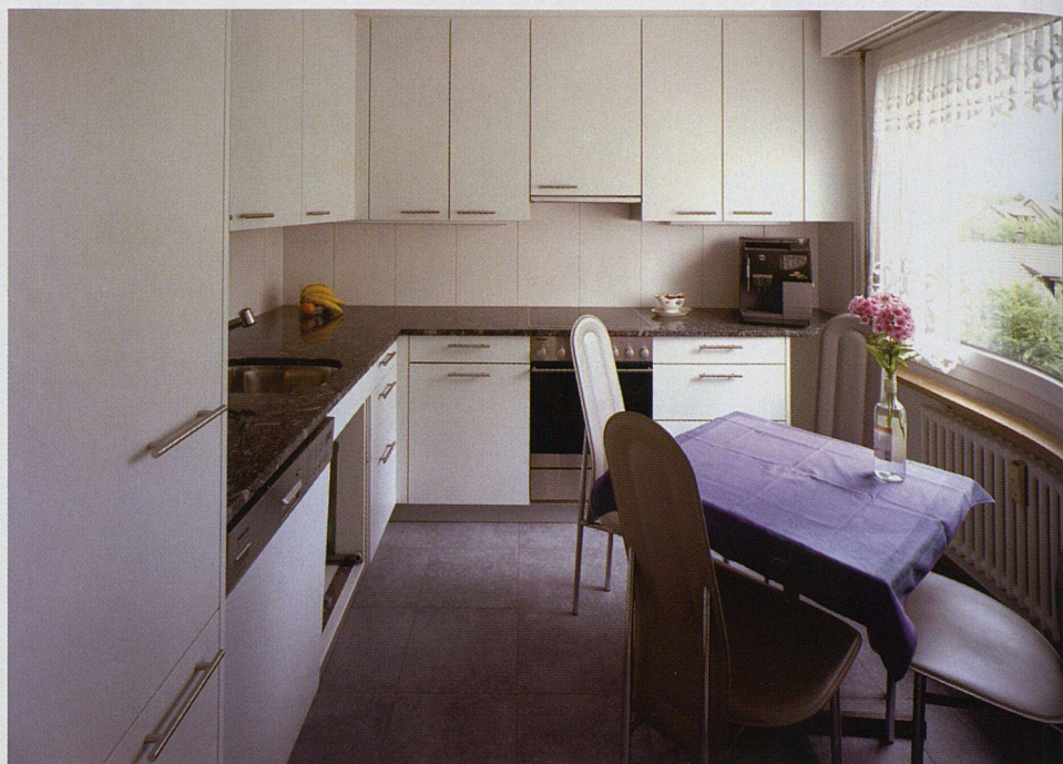
Kompakt, geräumig und zeitgemäss: So präsentiert sich die Küche heute.

Bei kleineren Genossenschaften – der Meiriacker umfasst 59 Wohnungen – diskutieren Vorstand und Mitglieder Bauvorhaben viel intensiver als bei grossen. Viele unterschiedliche Meinungen und Wünsche prasselten denn auch auf den Vorstand nieder. Rückblickend meint Hans-Rudolf Ott: «Am Schluss muss man den Mut haben zu sagen: So wird es für alle gemacht. Individuelle Lösungen sind schlicht und einfach nicht möglich. In diesem Zusammenhang haben wir uns auch juristisch abgesichert.»