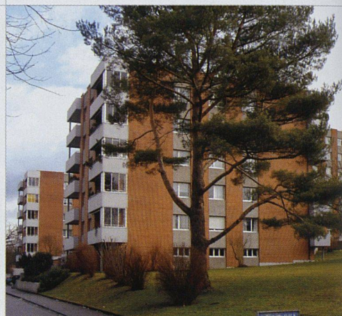
Die Siedlung Meiriacker liegt in parkähnlicher Umgebung an bevorzugter Lage in Binningen BL.