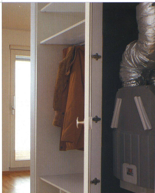
Kompaktlüftungsgeräte sind in Technikschränke eingebaut und für die Mieter einfach zugänglich.

Dennoch wird das Einhalten der SIA-Norm Lärmstörungen nicht in jedem Fall verhindern. Bei normaler Hörfähigkeit liegt der Pegel von 25 dB(A) zwar unmittelbar über der Wahrnehmungsschwelle. Aber die Tageszeit ent-