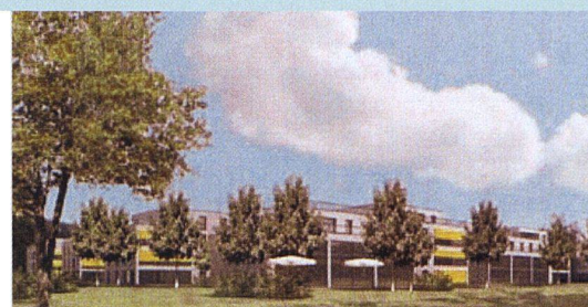
Die Punktbauten sind von durchlaufenden Grünflächen mit Laubgehölzen umgeben. So bildet die Siedlung einen fließenden Übergang zum angrenzenden Wald.

Dominanz des angrenzenden Waldes gewahrt werden. Auf städtische Aussenräume wird bewusst verzichtet. In den acht Häusern entstehen insgesamt 90 Wohneinheiten, die von der Zweieinhalbzimmer-Kleinwohnung bis zur Sechseinhalbzimmer-Familienwohnung, vom Reihnhaus bis zu Terrassen-, Attika- und Gartenwohnungen die ganze Vielfalt des Wohnens abdecken. Der Neubau wird ab 2009 voraussichtlich in zwei Etappen erstellt. (rom)