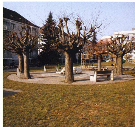
Der kürzlich neu gestaltete Spielplatz der Eisenbahner-Baugenossenschaft Zürich Altstetten bietet ein vielfältiges Angebot, das unterschiedliche Altersgruppen anspricht. Dabei hat man die Erwachsenen nicht vergessen.