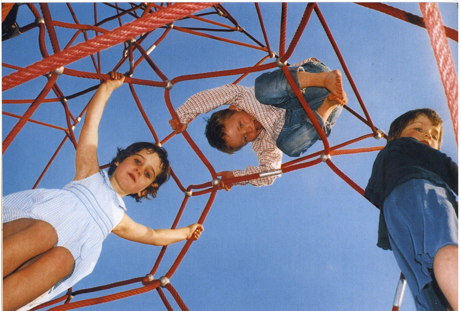
Einem Kletterturm kann kein Kind widerstehen.

Ein paar Geräte aus dem Katalog auswählen genügt nicht. Wer einen Spielplatz so gestalten will, dass er verschiedene Altersgruppen anspricht und erst noch zur Siedlung passt, sollte schon bei der Planung Fachpersonen beiziehen. Auch die Siedlungsbewohner sollten mitreden dürfen. Dazu gehören selbstverständlich die künftigen Nutzer: die Kinder.