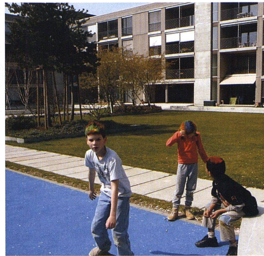
Ein geschützter Innenhof ist ideal fürs Kinderspiel: Die Neubauesiedlung Wohnstadion in Zürich Oerlikon (Gisa) besitzt eine sorgfältig gestaltete Anlage, die neben unterschiedlichen Spielmöglichkeiten auch viele Sitzmöglichkeiten unter dereinst schattenspendenden Bäumen bietet.