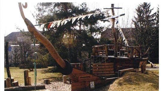
Das Schiff auf hoher See. Es scheint sich fast zu bewegen.