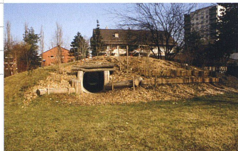
Die Bepflanzung des aufgeschütteten Hügels besorgten die Kinder.