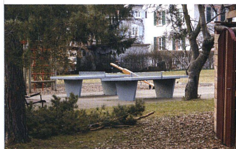
Mögen auch viele Erwachsene: Tischtennis spielen.