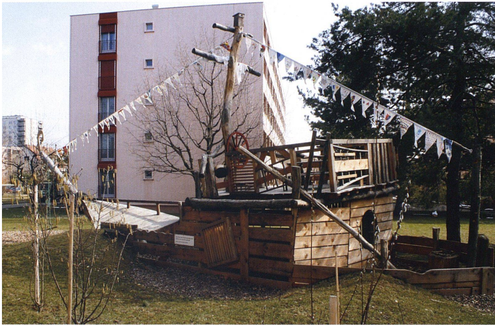
Das Piratenschiff haben die Siedlungsbewohner gemeinsam gebaut.