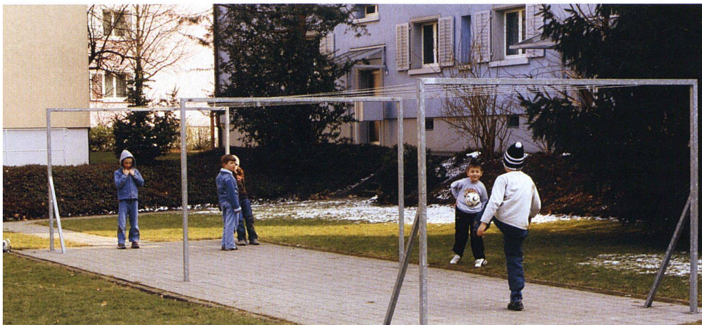
Fussball unter der Wäscheleine – das Kinderspiel in den Wohnsiedlungen ist nicht immer planbar.