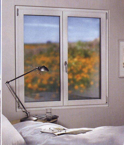
Renovationsfenster mit Sicherheitsbeschlag www.4b-bachmann.ch

Nicht selten ist bei Renovationsprojekten die Montage von neuen Fenstern ein mühseliges Unterfangen, erst recht, wenn dabei Aussen- oder Innenwände beschädigt werden. Mit dem Fenster «Aluba» von 4B Fenster AG soll der Einbau dank einer speziellen Modultechnologie in gerade einmal einer Stunde möglich sein. Zusätzliche Gips- und Malerarbeiten sind nicht nötig. Bezüglich Sicherheit bietet das Renovationsfenster standardmässig den 4B Sicherheitsbeschlag mit verstärkten Schliessteilen aus Stahl an.