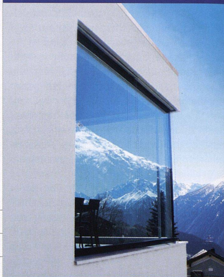
Profillose Fenster www.biene-fenster.ch

Das mittelständische Unternehmen Biene aus dem luzernischen Winikon führt in seiner Produktpalette das «Future-Fenster». Dieses Holzfenster fügt sich nahtlos in die Fassade, ohne sichtbare Brücke und Steg. Eine Weiterentwicklung von «Future» ist «Future 2», eine selbsttragende Konstruktion, dank der sich rahmenlose Fenster über mehrere Stockwerke hinweg erstrecken können. Eine solch vollflächige Glasfassade sorgt für lichtdurchflutete Räume und im Unterhalt für wenig Aufwand – die Reinigung der Flächen ist denkbar einfach.