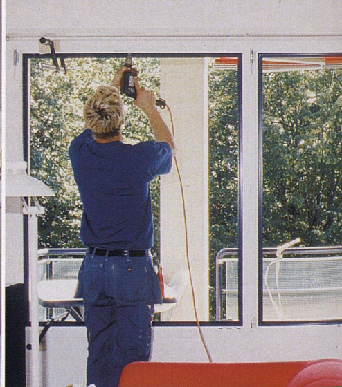
Die passende Jalousie zum Fenster www.gawo.ch

Hervorgegangen aus einer kleinen regionalen Schreinerei, ist die Gawo Gasser AG heute ein modernes Familienunternehmen mit langjähriger Tradition. Nebst Holz-, Holz-Metall- und Renovationsfenstern werden in den Fabrikationsanlagen auch Jalousien in Aluminium und Holz sowie Schiebeljalousien in Holz-Aluminium produziert. Das Unternehmen unterstreicht insbesondere seine Stärken in der Holzimprägnierung. Mit einer zusätzlichen speziellen UV-Oberflächenbehandlung sind die Fensterrahmen über sehr lange Zeit geschützt.