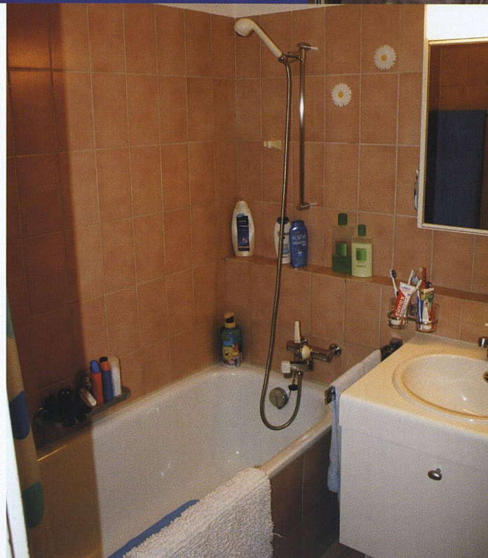
4 ½ Zimmer, ca. 100 m 2 , Baujahr 1985, Baugenossenschaft GISA

Es muss einfach praktisch sein. Ich brauche kein wahnsinnig schickes Bad. Lieber zahle ich einen tieferen Mietzins.