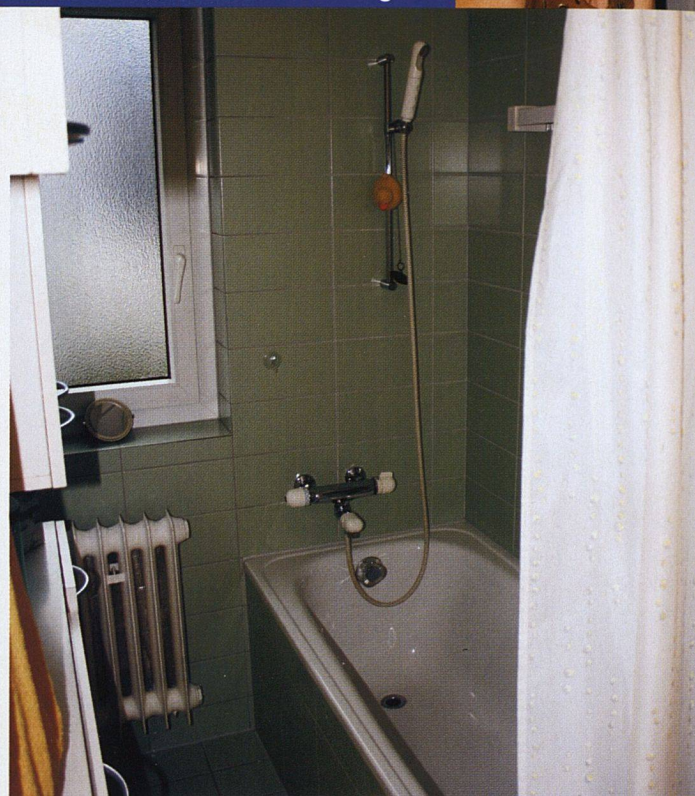
4 Zimmer, ca. 80 m², Baujahr 1949, Baugenossenschaft Luegisland

Jetzt leben nur noch mein Mann und ich in dieser Wohnung. Wir wohnten aber auch mit den beiden Kindern bereits hier. Schon vor dem Umbau hatten wir Bad und WC getrennt.