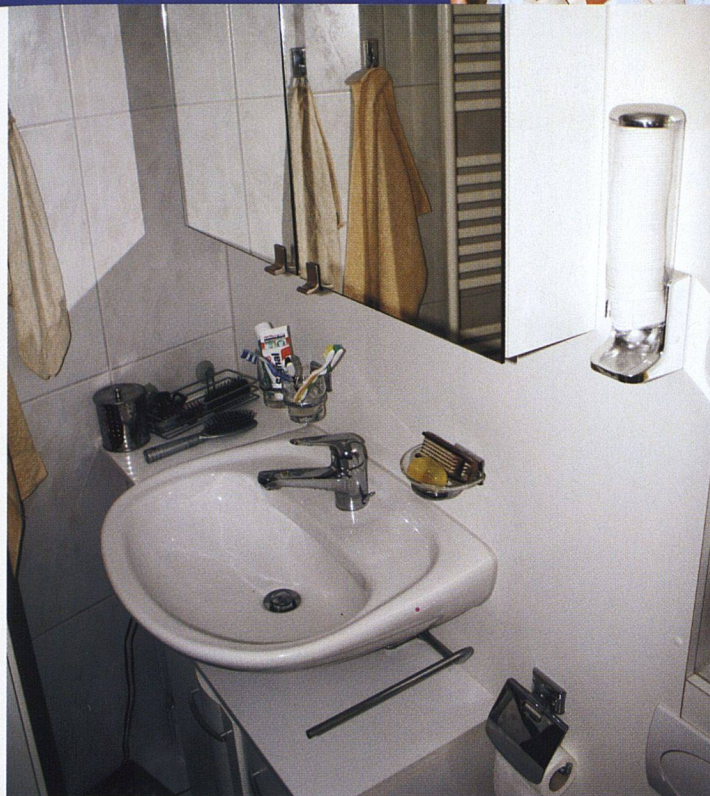
4 Zimmer, ca. 80 m 2 , Baujahr 1950, Baugenossenschaft für neuzeitliches Wohnen

Im Moment sind wir wieder zu viert. Unser Sohn ist nach einem längeren Aufenthalt in Graubünden wieder nach Zürich zurückgekehrt. Nach einem Umbau haben wir keine separate Toilette mehr. Vom ehemaligen WC konnte man dafür der Küche etwas Raum zuschlagen.