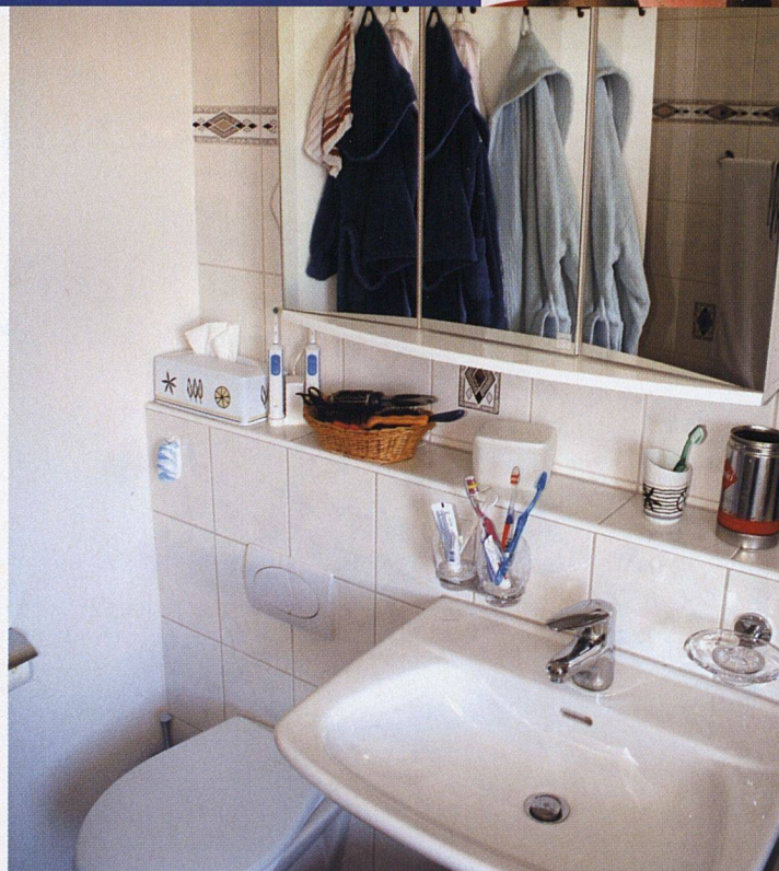
5 ½ Zimmer, ca. 100 m², Baujahr 1965, Stiftung Wohnungen für kinderreiche Familien

1. Obwohl wir «nur» zwei Kinder haben, leben wir in einer Siedlung der Stiftung Wohnungen für kinderreiche Familien. Weil wir aber als Hauswarte amten, bekamen wir trotzdem eine Wohnung, da ein Zimmer als Büro dient. Ich bin übrigens schon in dieser Wohnung aufgewachsen. Wir haben ein Bad mit WC und dazu eine separate Toilette mit Lavabo.