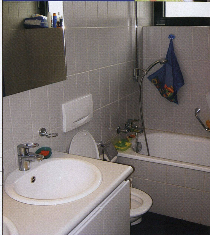
4 ½ Zimmer, ca. 100 m², Baujahr 1999, Siedlungsgenossenschaft Eigengrund

1. Wie viele Personen leben im Haushalt und wie viele Nasszellen stehen zur Verfügung?