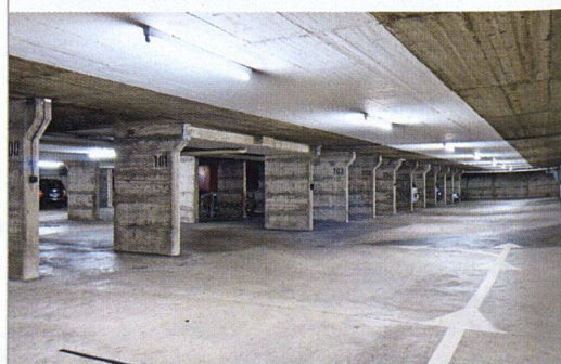
Düstere Stimmung: der nicht sanierte Garagenteil.

TEIL DER WOHNQUALITÄT. Heute werden Tiefgaragen nicht mehr stiefmütterlich behandelt. Planer und Architekten verstehen sie nicht mehr einfach als Ort, wo Fahrzeuge verstaut werden, sondern wo Menschen ankommen