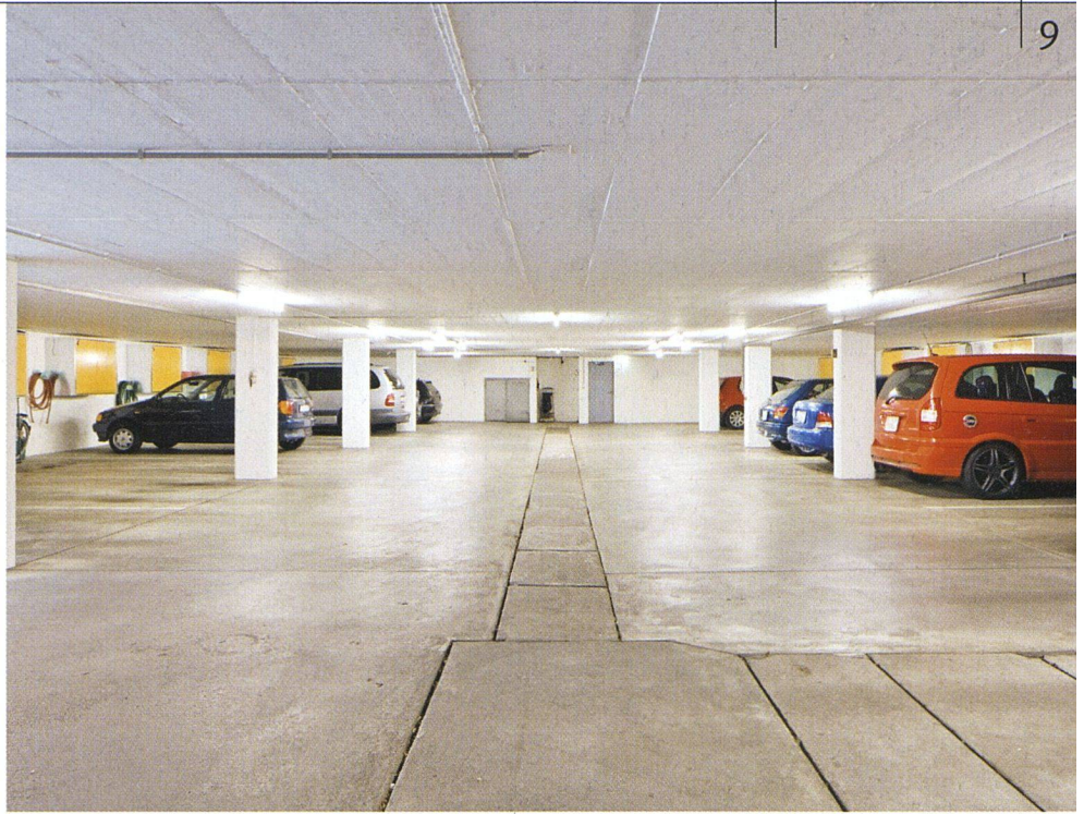
In der Siedlung Hirzenbach hat die ASIG die Qualität mit geringem Aufwand stark verbessert: Zwischen der sanierten und der alten (unten) Tiefgarage liegen Welten.