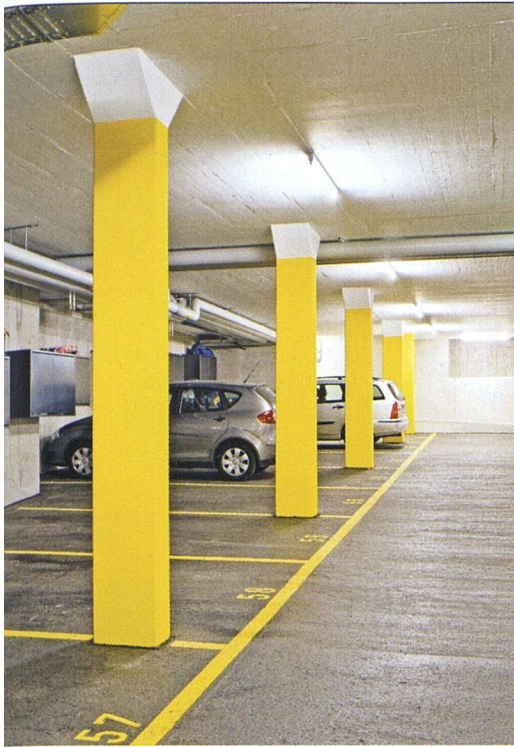
Die Tiefgarage der Neubausiedlung Ruggächern der ABZ ist hell und benutzerfreundlich.