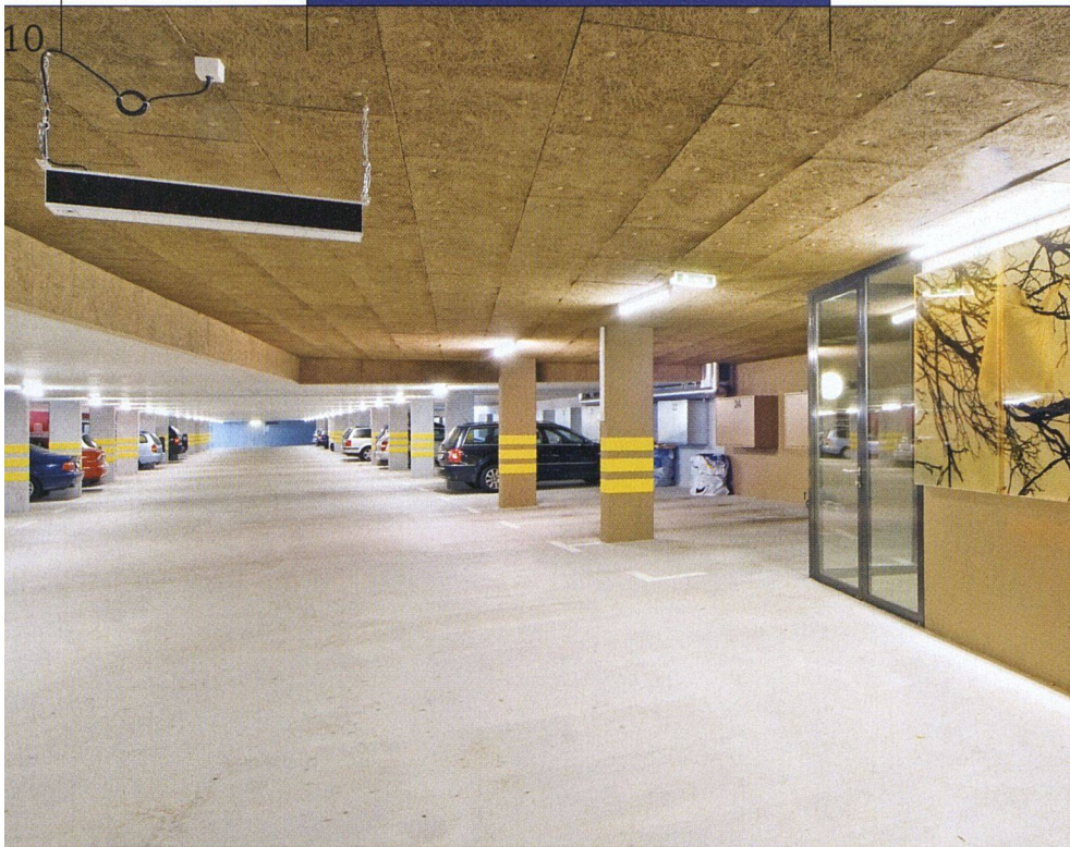
Farbgestaltung und Kunst am Bau machen die Tiefgarage in der Siedlung Steinacker der ASIG zu einem eigentlichen Empfangsraum.