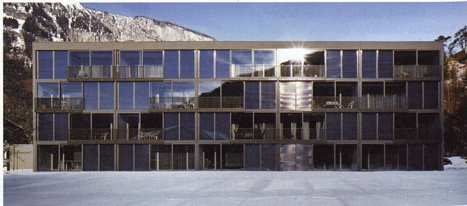
Die Nutzung der Sonnenwärme ist ein Gebot der Stunde. Bei den Alterswohnungen in Domat/Ems (vgl. wohnen 5/05) schützt ein Spezialglas gleichzeitig vor Überhitzung.