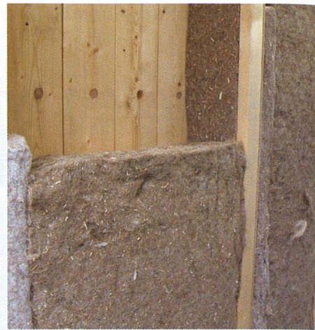
In Deutschland sind Dämmstoffe aus nachwachsenden Naturprodukten wie Wolle oder Hanf weit verbreiteter als in der Schweiz. Eine Ausnahme bildet das Ökohaus in Mosnang (SG), wo eine Dämmung auf Hanfbasis zum Einsatz kam (Bild rechts).