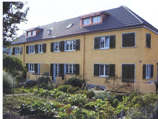
Nach der sanften Renovation erstrahlen die Biwog-Bauten im Bieler Lindenquartier in neuem Glanz.