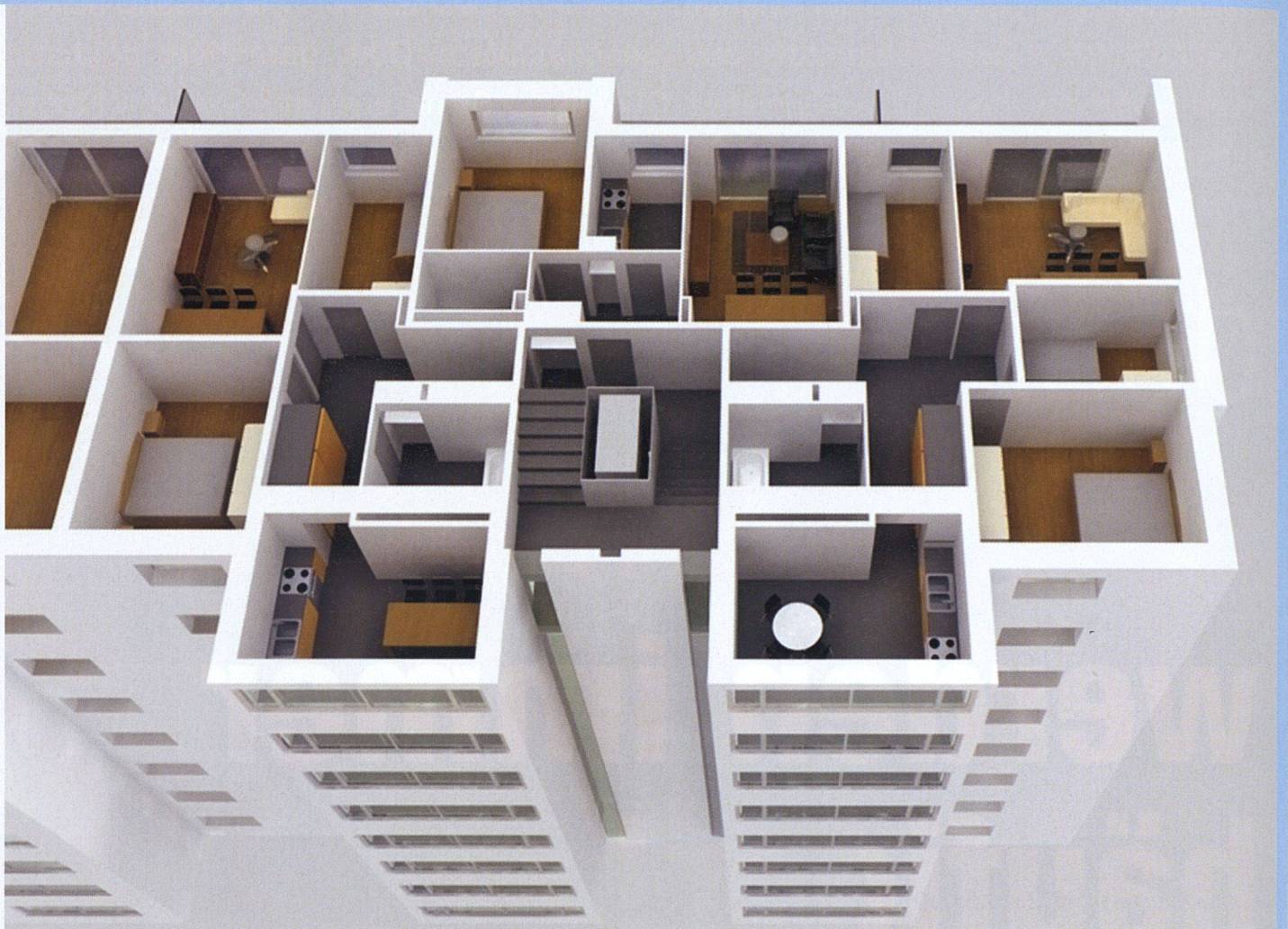
Turmanbauten schaffen in der Siedlung Hirzenbach der Siedlungsgenossenschaft Eigengrund Platz für moderne Wohnküchen.

SIEDLUNGSGENOSSENSCHAFT EIGENGRUND, ZÜRICH