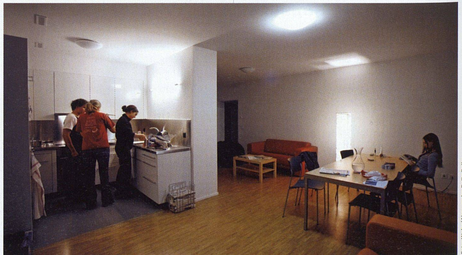
Modernes Studentenleben in der neuen Woko-Siedlung am Max-Bill-Platz in Zürich Oerlikon.

stetten mieten konnte. Nach und nach kamen weitere Liegenschaften von der Stadt und Privaten hinzu. Richtig vorwärts ging es aber erst durch die Gründung der Stiftung für Studentisches Wohnen 1987, die von den beiden Hochschulen, der Stadt und der Studentischen Wohngenossenschaft getragen wird. Mit den durch die Stiftung bereitgestellten Geldern war es möglich, innert weniger Jahre mehrere hundert neue Zimmer zu erstellen. Die Stiftung sorgt dabei für die Finanzierung und den Bau der Liegenschaften, während die Woko die Häuser betreibt.