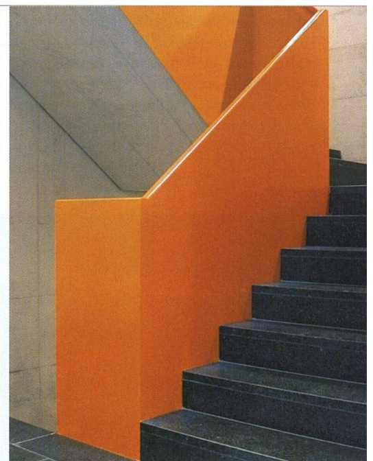
Das mutige Farbkonzept setzt sich in den Treppenhäusern fort.