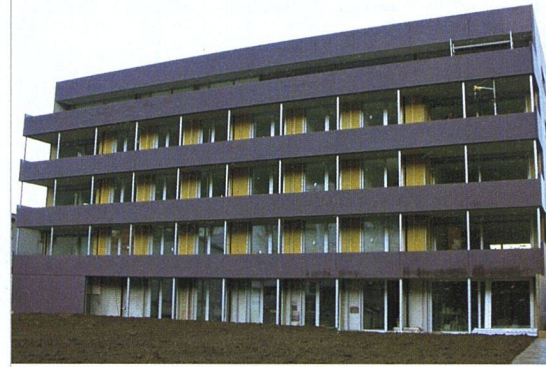
Das Langhaus, das Schutz vor dem Strassenlärm bietet, ist mit Betonplatten eingekleidet.

Zu Recht erfährt der nachwachsende Rohstoff Holz im Rahmen der Nachhaltigkeitsdebatte einen starken Aufschwung. Noch ist seine Anwendung aber keine Selbstverständlichkeit, und so gab es auch im Vorstand der Genossenschaft Matt Diskussionen um diese Materialwahl. Beispielsweise musste man sich klar sein, dass Fassadenanstriche in kürzeren Abständen nötig sind als bei einem Verputz. Diese Unterhaltsproblematik hatte weitere Folgen: Ursprünglich hatte die Genossenschaft wegen der bestehenden Nachfrage auch den Verkauf von Wohnungen im Stock-