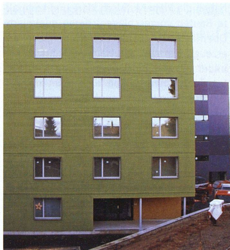
Eingangssseite der Punkthäuser: Deutlich erkennbar die Holzverkleidung.

wie Staub und verstopfte Leitungen behoben sind.