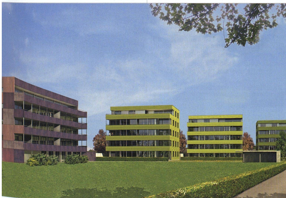
Visualisierung der Gesamtanlage.

werkeigentum ins Auge gefasst. Dafür hätte sie eines der Punkthäuser reserviert. Aber neben anderen Bedenken führte das Argument des Unterhalts dazu, alle Bauten gleich zu behandeln. Wenn ein Haus verkauft worden wäre, hätte man damit rechnen müssen, dass es früher oder später anders unterhalten würde, was die Ensemblewirkung beeinträchtigen könnte. Holz kommt auch bei der Heizung zum Einsatz. Pellets sind nicht nur CO 2 -neutral, sondern heute auch so weit verbessert, dass die Kinderkrankheiten der Systeme ▶