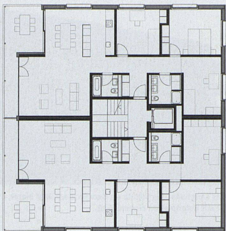
Bei den Grundrissen fallen die grossen Wohnzimmer auf (Obergeschoss Punkthaus).