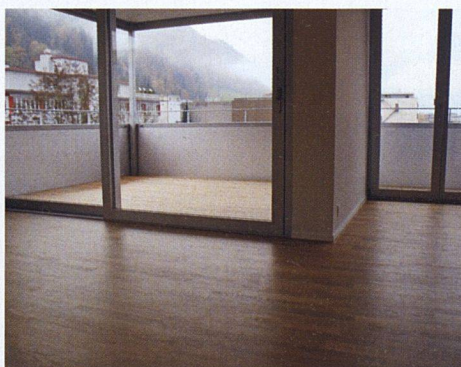
Grosszügige Wohnzimmer und Loggien entsprechen den Wünschen der Mieter.