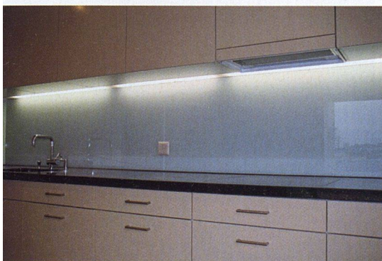
Gehobener Ausbau: Metallküchen mit Granitabdeckungen und Rückwänden aus gestrichenem Glas.

Mietzinsbeispiele: 3½ Zimmer, 93 m 2 : 1500-1700 CHF + 140 CHF NK 4½ Zimmer, 110 m 2 : 1800-1900 CHF + 200 CHF NK