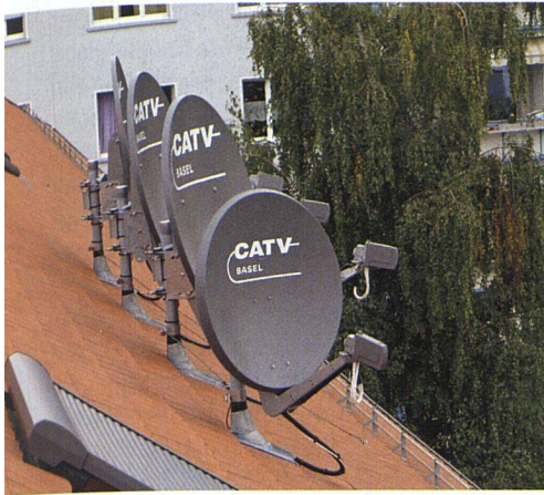
Via Satellit können ohne monatliche Gebühren bis zu 1000 Fernsehprogramme empfangen werden. Mit einer Gemeinschaftsanlage auf dem Dach eines Mehrfamilienhauses lässt sich der Schlüsselwald an der Fassade vermeiden.