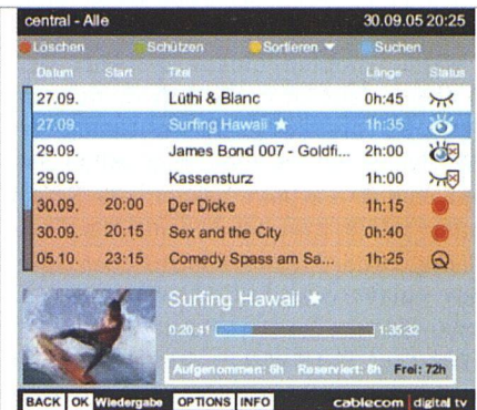
Die Möglichkeiten des digitalen Fernsehens sind verlockend: Mit einem elektronischen Programmführer hat man jederzeit den Überblick über sämtliche Programme. Per Knopfdruck lassen sich Sendungen anhalten, aufzeichnen und zeitversetzt anschauen.

ALTERNATIVE VOM HIMMEL. Die Tatsache bleibt: Fürs Fernsehen müssen die Kunden künftig tiefer in die Tasche greifen. Viele Konsumenten und Hausbesitzer überlegen sich, ob sie diese bittere Pille schlucken müssen. Der Mieterverband gibt den Mietern Tipps, wie sie aus eigener Initiative den Anbieter wechseln können. Und der Hauseigentümerverband rät seinen Mitgliedern, den Cablecom-Anschluss vor-