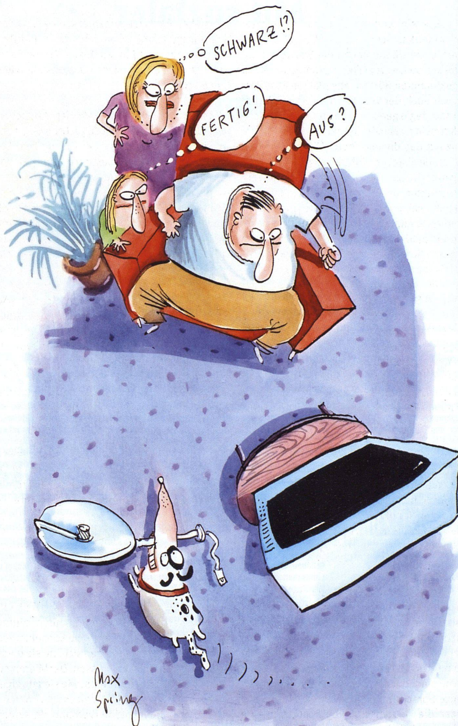
Illustration: Max Spring

Erst im 2003 gelangt es der Cablecom, mit einer Umschuldungsaktion den unternehmerischen Spielraum zu sichern. Zwei Jahre spä-