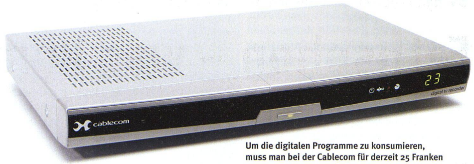
Um die digitalen Programme zu konsumieren, muss man bei der Cablecom für derzeit 25 Franken pro Monat ein Empfangsgerät, eine so genannte Set-Top-Box, mieten oder kaufen. Ab April ist für sechs Franken auch eine günstigere Set-Top-Box erhältlich, mit der jedoch keine Sendungen aufgezeichnet werden können.

ter folgte ein weiterer Überraschungscoup: Die amerikanische Liberty-Global-Gruppe streckte die Hände nach dem Schweizer Kabelriesen aus, worauf dieser prompt den gross angekündigten Börsengang platzen liess. Damit war auch der Weg für die weitere Wachstumsstrategie geebnet. Die nun amerikanisch beherrschte Netzbetreiberin setzt dabei ganz auf das digitale Pferd. Über eineinhalb Milliarden Franken hat sie gemäss eigenen Angaben in den letzten fünf Jahren in ihre Infrastruktur investiert und sie damit für zukunftsweisende Dienste wie Breitband-Internet, digitale Telefonie, digitales Fernsehen und bald auch hochauflösendes TV (HDTV) gerüstet. So will etwa die SRG SSR idée Suisse im Jahr 2010 auf die neue Norm umstellen, die eine noch höhere Auflösung und ein besseres Bild verspricht.