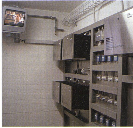
Über eine Kopfstation werden mehrere Haushalte einer Siedlung mit Fernsehprogrammen versorgt.