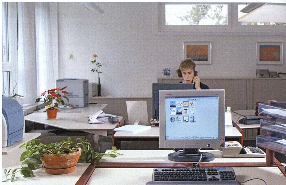
Ärgerlich und leider gar nicht selten: wenn sich auf einem Programm gespeicherte Daten nicht auf ein anderes übertragen lassen.

REM: DIE SOFTWARE DER GROSSEN. Als modernste Immobilienverwaltungslösung auf dem Schweizer Markt gilt REM: Dabei handelt es sich um ein Softwarepaket, das von den vier grossen Verwaltungen PSP, Livit, Helvetia Patria und Wincasa entwickelt und durch die Berner Firma Garaio programmiert wurde. Der Vertrieb, die Implementierung sowie der Helpdesk für die Benutzer laufen über die IBM. Gerade dieses Beispiel veranschaulicht den enormen Entwicklungsaufwand: Die Investitionen summieren sich bis heute auf etwa zwölf Millionen Franken. Den Grundausbau