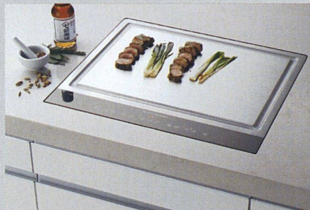
Das Flächenkochen ist ein neuer Trend. Im Bild der Induktions-Teppan-Yaki von Electrolux.

Der Steamer ist der Star unter den Küchenneuheiten. Kochen und Garen mit Dampf liegt ganz im Trend der leichten Küche. Aus der grossen Vielfalt das richtige Gerät zu finden, ist allerdings gar nicht so einfach. Sanitas Troesch bietet deshalb markenunabhängige Seminare (siehe www.sanitastroesch.ch ).