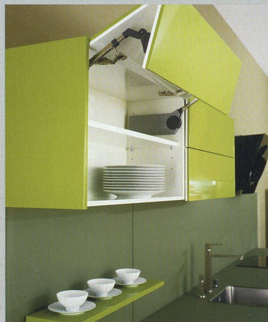
Square von Forster kombiniert unterschiedliche Grüntöne und bietet praktische Hochfaltklappen.

VON RICHARD LIECHTI ■ Beim führenden Schweizer Küchenanbieter, der Arbonia Forster Holding AG, stehen mittlerweile drei Pferde im Stall, die unterschiedliche Marktsegmente abdecken. Piatti hat sein umfangreiches Sortiment mit einer Reihe neuer Farben ergänzt. Nebelgrau, Sandbeige oder Crème dürften sich auch für Mietwohnungen eignen, bieten sie doch den erwünschten neutralen Ton, der möglichst viele Bewohner anspricht. Viel Spielraum für den Einsatz von Farben bei den Accessoires bietet die Neuheit «Bianco», die in hochglanzlackiertem Weiss daherkommt. Daneben zeichnet sich ein Trend zu Brauntönen ab. Bei den Möbeln fallen die neuen Kehrachtelemente auf. Sie lassen sich durch Antippen öffnen und erleichtern durch ver-