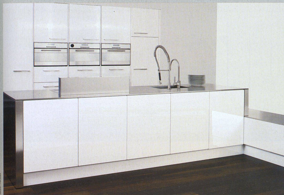
Stahl pur: Die Linie Cube von Forster mit Fronten in hochglanzlackiertem Stahl und Arbeitsplatten aus Edelstahl.

Auch an der diesjährigen Swissbau waren Küchen in mutigen Farbkombinationen zu sehen. Gleichzeitig zeichnet sich ein Trend zu eleganten, neutraleren Farbtönen ab, der den Ansprüchen von Baugenossenschaften entgegenkommt. Im Gerätebereich war der Steamer eindeutig der Star. Einsteigermodelle sollen für noch grössere Verbreitung sorgen.