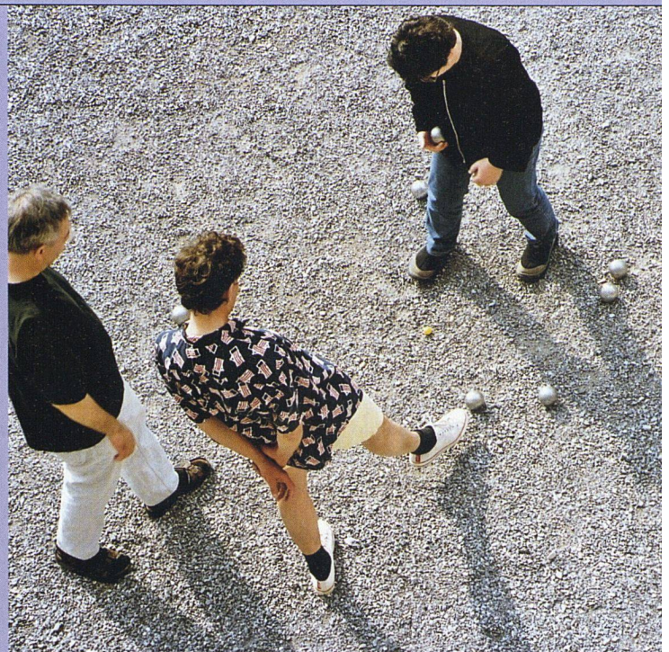
Impressionen aus dem Siedlungsleben im Kraftwerk1. Eine Untersuchung belegte kürzlich die hohe Zufriedenheit der Bewohnerinnen und Bewohner.

über eine Benutzerorganisation, eine Art Hausverein.