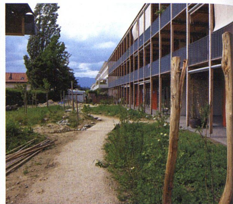
Der Naturgarten wird sein definitives Gesicht erst in etwa zwei bis drei Jahren erhalten.

nungstypen zu schaffen, insbesondere 3-, 4-, 5- und 6-Zimmer-Wohnungen, wobei die Küche ebenfalls als ein Zimmer zählte. Andere bewusste Entscheidungen waren: eine minimale Zimmergrösse von zwölf Quadratmetern, eine zum Wohnraum offene Küche, ein Maximum an Fenstern, um vom Tageslicht zu profitieren und die Stromkosten zu senken, gemeinschaftliche Räume wie eine Werkstatt, eine gegen den Gemeinschaftsgarten orientierte Waschküche, einen Gewerberaum, der auch eine Verbindung zum Quartier schaffen soll, ein gemeinsames Esslokal und – Pünktchen auf dem i – ein Gästezimmer, das gratis zur Verfügung gestellt wird.