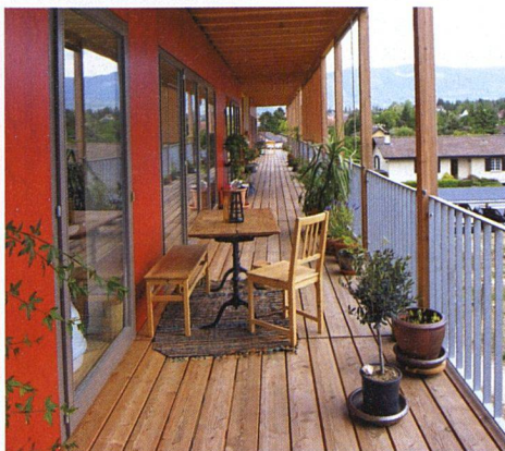
Kommunikatives Konzept: Wohnräume und Küche führen auf die durchgehenden Laubengänge und den gemeinsamen Garten hinaus.