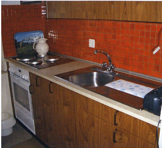
Die schmalen Küchen in veralteter 70er-Jahr-Optik entsprachen nicht mehr den heutigen Bedürfnissen.