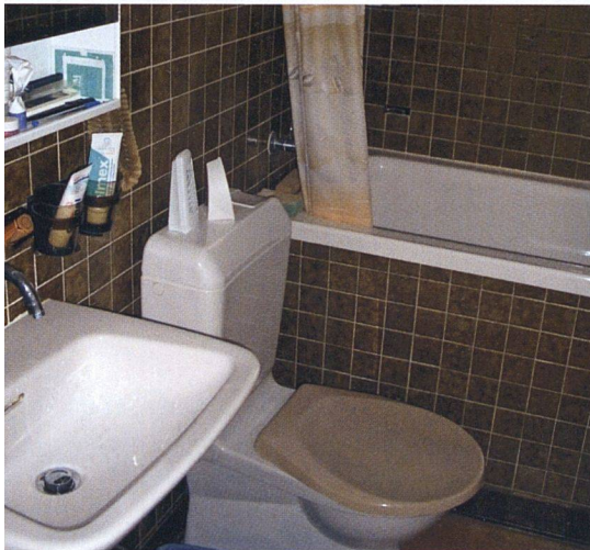
Die Bäder vor der Sanierung: Sitzbadewannen und braune Kacheln auf weniger als drei Quadratmetern.