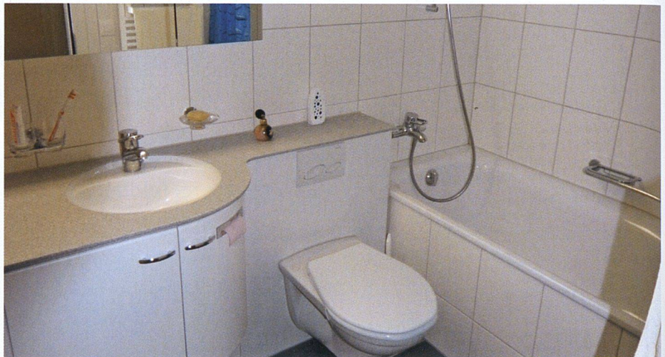
Die vergrösserten Badezimmer erstrahlen in neuer Frische.

auf weniger als drei Quadratmetern nicht gerade zum Verweilen einladen. Den grössten Gewinn erfahren die Wohnungen durch den Küchenanbau, der zu einer Wohnungsvergrösserung von fast zwölf Quadratmetern führt. Heute findet sich anstelle einer etwas düsteren, sehr schmalen Küche mit braunen Schränken und orangefarbenen Fliesen in altmodischer 70er-Jahre-Optik eine moderne Wohnküche mit hellgrauen Schränken und Glaskeramikherd, in der ein grösserer Tisch für die ganze Familie oder auch für Gäste Platz hat. Bad und Küche sowie der Eingangsbereich sind mit einem grauen Bodenbelag in Schieferoptik ausgelegt, der für ein einheitliches Erscheinungsbild sorgt. Dies kommt gut an: «Die Bewohnerinnen und Bewohner sind sehr zufrieden mit dem Umbau», beobachtet der Geschäftsleiter.