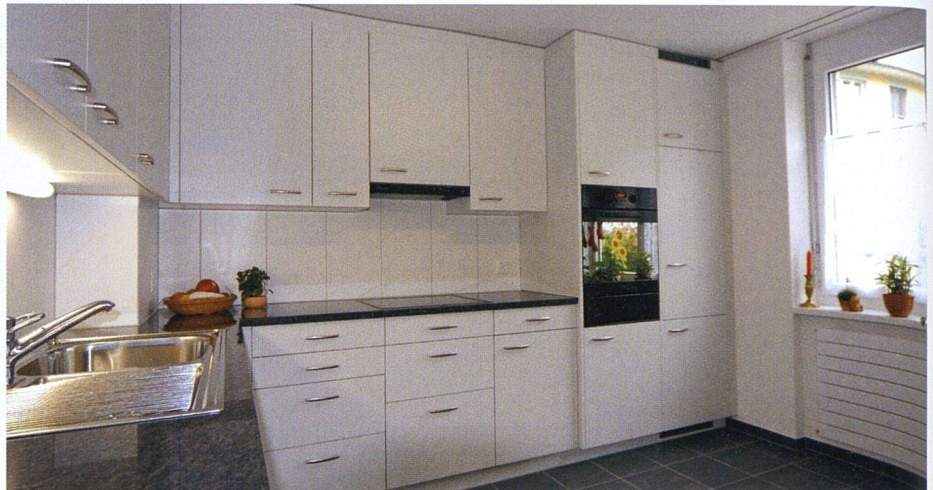
Die neuen Küchen wurden in die Anbauten verlagert und auf fast zwölf Quadratmeter vergrössert.